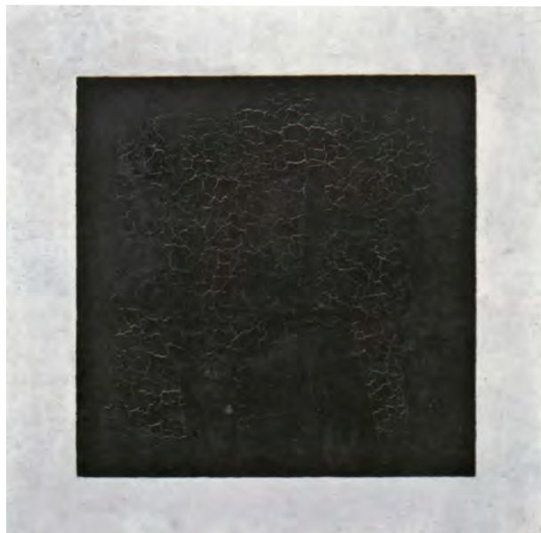
Quadrilatère dit carré noir, été 1915 Huile sur toile 79,9 x 79,5 cm Coll : GTG, M