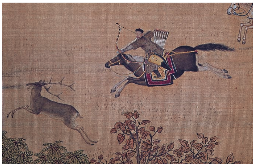
Fig. 44 : Castiglione et al., Mulantu , détail, musée Guimet, Paris.