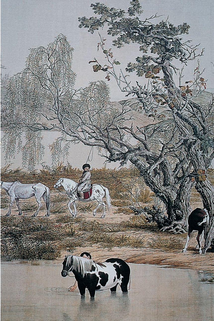
Fig. 11 : Les cent chevaux , détail, National Palace Museum, Taipei.

collectionnant littéralement les portraits de lui-même, les mettant au service à la fois de l'idéologie politique et de son narcissisme.