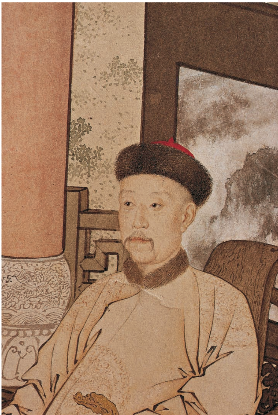
Fig. 56 : Portrait de l'empereur Qianlong dans le rouleau : Les Kirghiz-Qazaq offrant en tribut des chevaux , détail, musée Guimet, Paris.

24 x 30 cm 258 pages 80 illustrations en couleurs Couverture cartonnée contrecollée Prix : 59 € ISBN : 978-2-35278-026-7