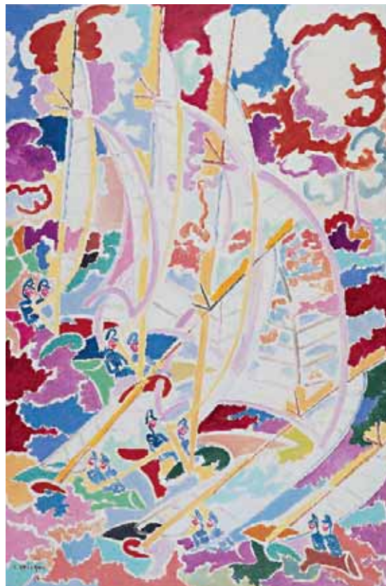
Les Régates , 1952 Huile sur toile, 146 x 97 cm. Collection particulière