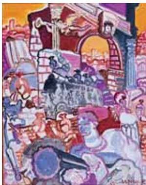
Histoire romaine, 1957 Huile sur toile, 93 x 74 cm. Collection particulière