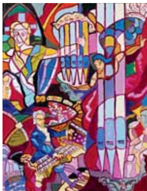
Choral pour la Pentecôte, 1966 Huile sur toile, 146 x 114 cm. Collection particulière