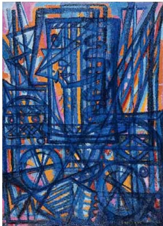
Jeanne d'Arc traversant la Loire , 1940 Huile sur toile, 100 x 73 cm. Collection particulière