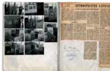
Livres de carrière, 1962, cahiers reliés spirale, 27 x 21 cm. Collection particulière

remarque venait autant du côté figuratif que du côté abstrait. [...] Et, de fait, le style de Lapicque bat continuellement en brèche techniquement deux notions rationnelles de l'espace : la perspective classique et l'espace abstrait. [...] C'est dire que le phénomène Lapicque joue au contact de la faille abstraction-figuration, mais que comme la faille n'est pas la séparation mais le rapport de ses deux plans opposés, l'art de Lapicque est le rapport continu de la figuration à l'abstraction et vice-versa [...]