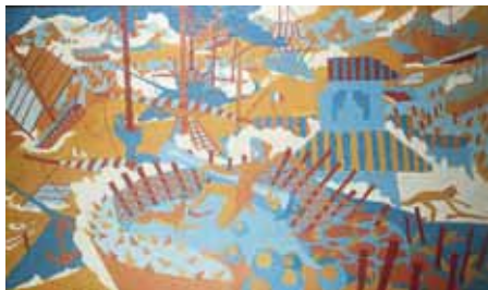
Prise de Ma-Kong par l'amiral Courbet, 1935

Historien de l'art, commissaire d'exposition