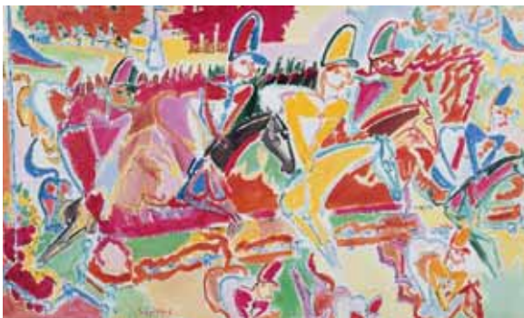
Le Bull-Finch , 1951 Huile sur toile, 89 x 147 cm. Collection particulière