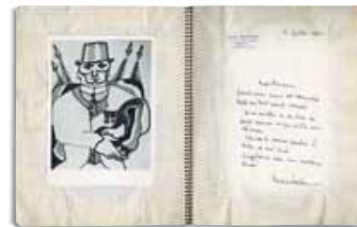
Livre de carrière, 1962, cahier relié spirale, 27 x 21 cm. Projet d'illustration pour Appareil de la terre , de Jean Follain, et lettre de Jean Follain à Charles Lapicque (2 juillet 1962). Collection particulière

Ignoré, méprisé même, pendant toutes ces années qui ont vu la progression puis le triomphe de l'abstraction, aucun ensemble de son œuvre n'avait été présenté à Paris depuis 1967. [...] Quand on regarde aujourd'hui ces œuvres baroques et colorées, on est surpris par l'actualité de cette peinture. Considérée comme rétrogradée à l'époque de sa création, la voilà brusquement placée à l'avant-garde, si ce n'est à la « transavant-garde ». Comme si ce vieux monsieur indigné de 85 ans voyait chaque jour de nouveaux héritiers se déclarer [...]