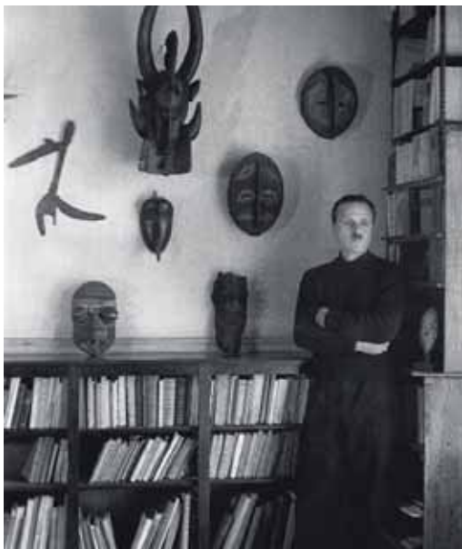
Charles Lapicque dans son atelier de la rue Froidevaux, à Paris, avec ses objets d'art premier, 1954

CHARLES LAPICQUE Théizé (Rhône), 1898 - Orsay (Essonnes), 1988