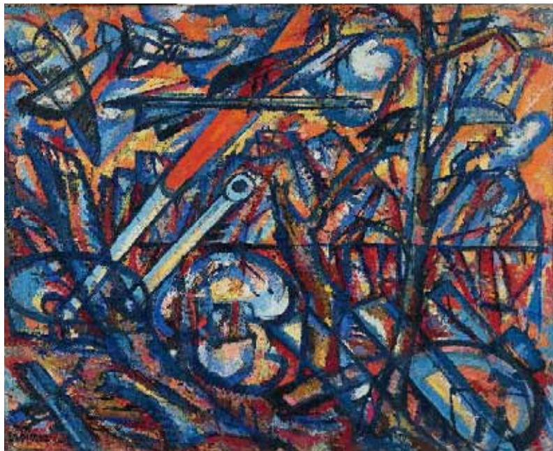
Attaque aérienne , 1940 Huile sur toile, 81 x 100 cm. Collection particulière