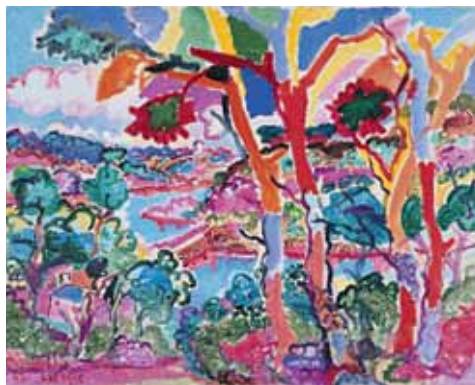
Le Cleuziat, 1957 Huile sur toile, 73 x 92,5 cm. Collection particulière

[...] Peur de rien, Lapicque, ni de l'art décoratif, ni du croquis hâtif. Peur de rien parce qu'il sait depuis toujours la vanité des choses de l'art qui n'est qu'un reflet des vanités des choses de la vie. Alors il s'amuse, Lapicque, il ne prend rien au sérieux. La dérision, il la manie avec brio. [...] Et c'est quand il s'abandonne que Lapicque est le meilleur. La fatuité, la prétention, la suffisance de nombre de ses confrères sont par là même tournées en ridicule. Les objets