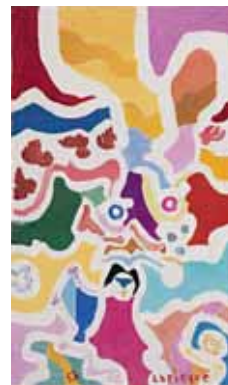
Portrait de Nicolas Fouquet, 1953 Huile sur toile, 55 x 33 cm. Collection particulière

symboliques du thème iconographique de la vanité, se retrouvent bien sûr chez Lapicque. Le squelette, la « danse macabre », Hamlet, les calvaires, L'homme et la mort (1945), les funérailles ( Funérailles étrusques , 1959).