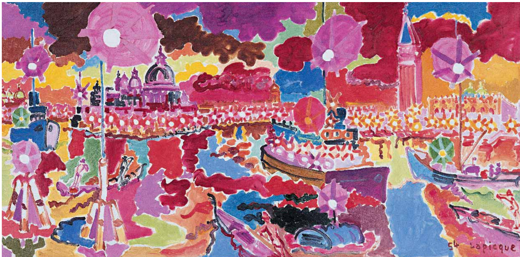
Coucher de soleil sur Venise, 1954 Huile sur toile, 60 x 120 cm. Collection particulière