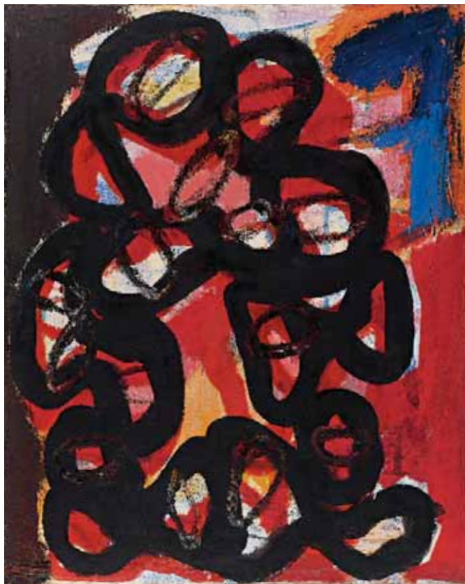
L'Adieu, 1947 Huile sur toile, 80 x 65 cm. Collection particulière