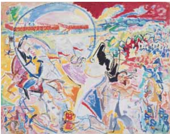
La Bataille de Waterloo , 1949 Huile sur toile, 114 x 146 cm. Collection particulière