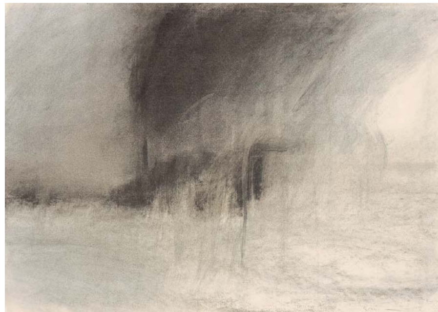
Taches d'arbre , 1991, fusain, 70,3 x 99,6 cm Collection de l'artiste