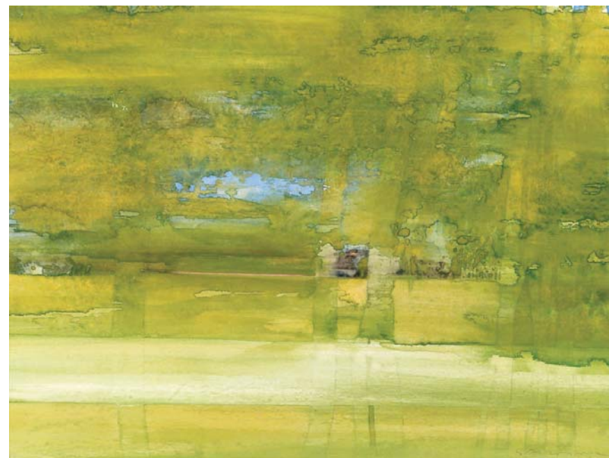
Passage II , 1980, aquarelle, 56 x 76 cm Collection D.Klitzschmüller, Berlin