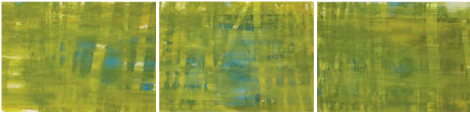
Passage - Reflet , 1980, triptyque, aquarelle, 114 x 160 cm x 3 Collection Essl, Kunst der Gegenwart, Klosterneuburg, Vienne