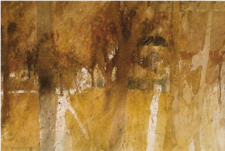
Bessancourt , 1976, aquarelle, 32,5 x 47,7 cm Collection privée, Essen, Allemagne