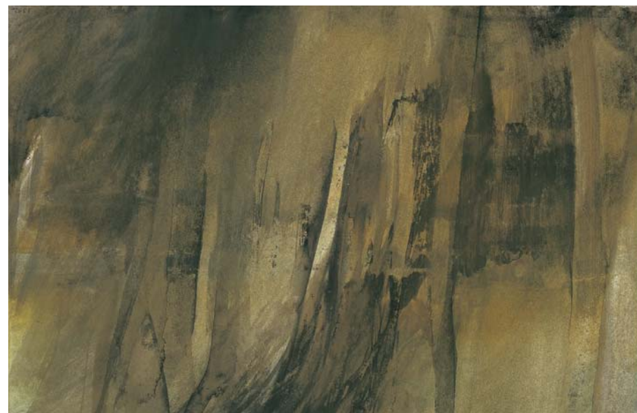
Arbres , 1983, acrylique, 32 x 50,3 cm Collection N. Bottet, Paris