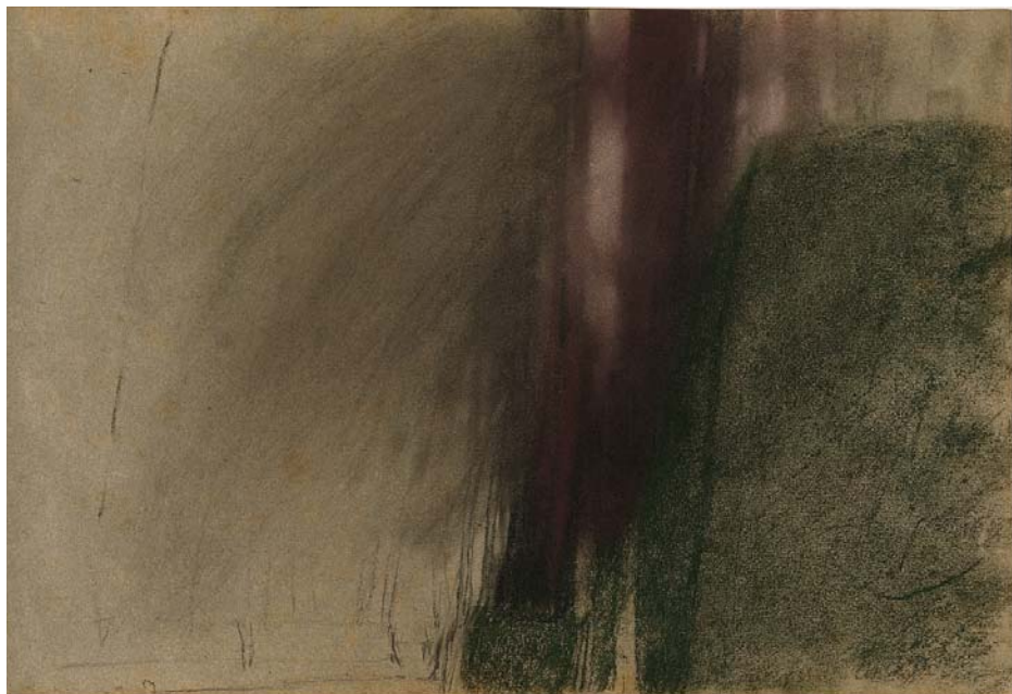
Marly , 1984, pastel, 30,2 x 44,3 cm Collection N. Bottet, Paris