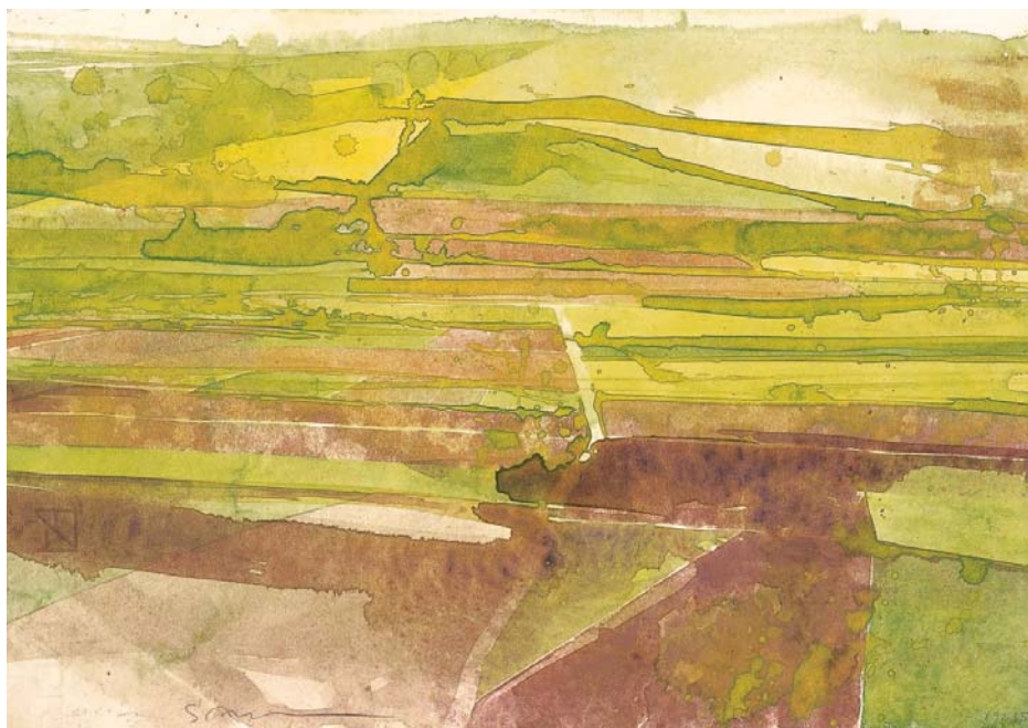
Felder , 1992, aquarelle, 25 x 35 cm Collection de l'artiste