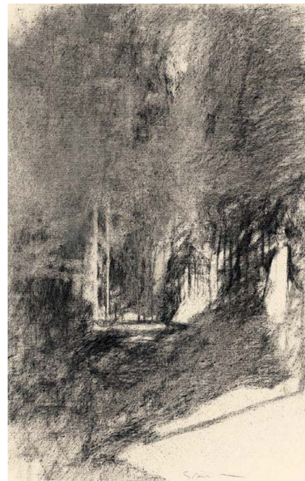
Tocqueville II, 1999, fusain sur toile, 49,4 x 32,3 cm Collection de l'artiste