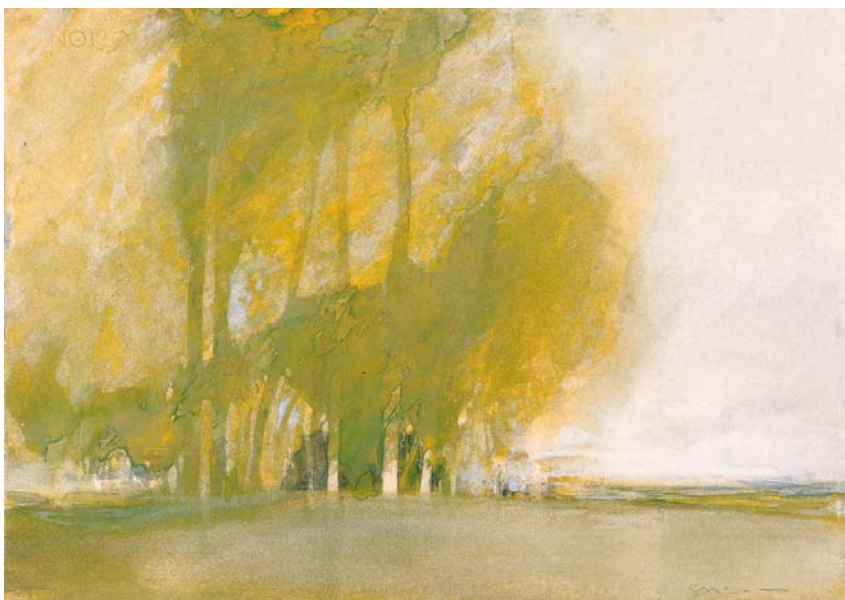
Grüne Baume , 1983, aquarelle et acrylique, 35,4 x 49,8 cm Collection privée, Paris