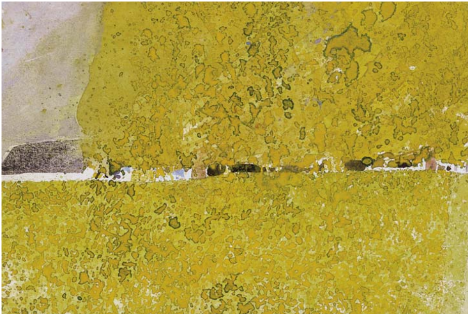
Gelbe Nahtstellen , 1981, aquarelle, 15,3 x 23,6 cm Collection Dr. Otto Staindl, Salzburg