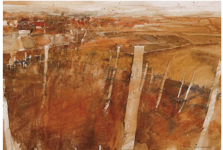
Paysage de la Champagne , 1978, aquarelle, 34,8 x 50 cm Albertina Museum, Vienne