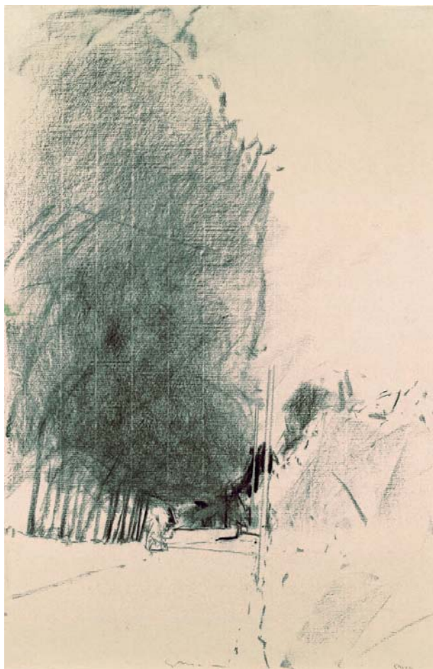
Vers..., 1991, fusain, 49,9 x 32,6 cm Collection N. Bottet, Paris